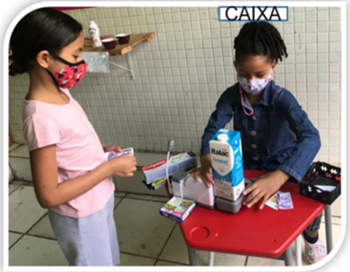
2º ANO D